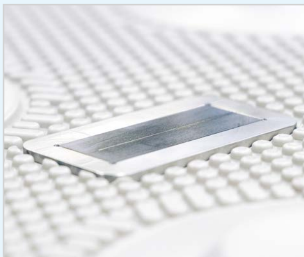
Der Sensor sitzt formschlüssig im Filterelement.

Blau = typischer Prozessablauf ; Grün = verkürzter Prozessablauf dank LENSER i-Plate