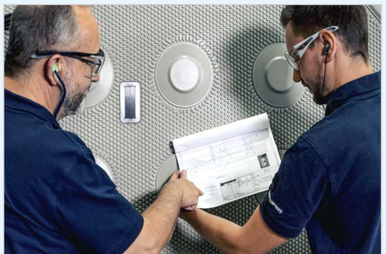
#FiltrationExperts während einer Qualitätskontrolle am installierten Sensor.